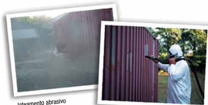
Jateamento abrasivo convencional