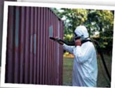
Jateamento abrasivo com baixa produção de pó com Sponge-Jet